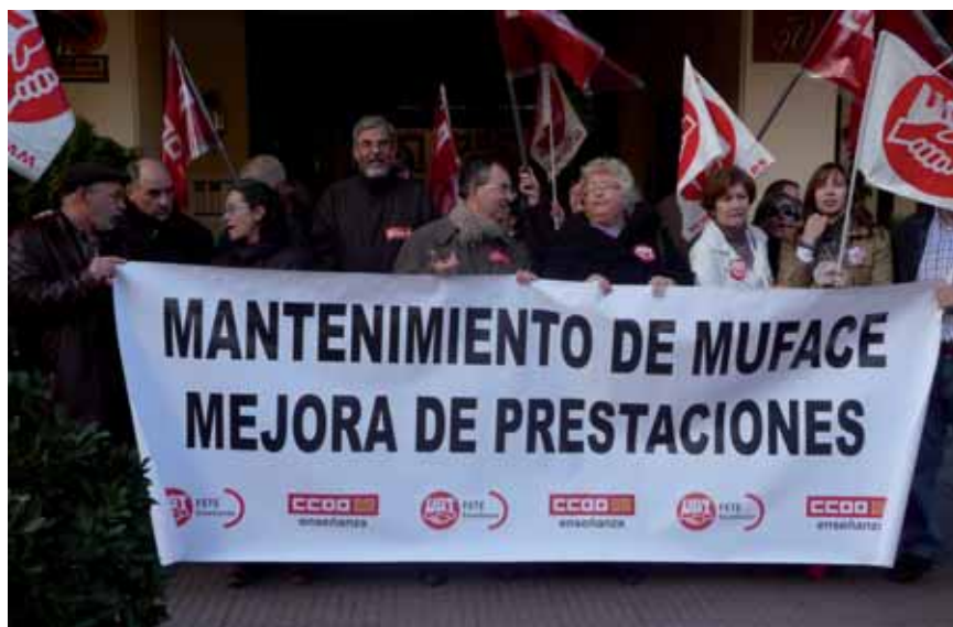
La Federación de Enseñanza se concentra en favor de MUFACE

Por el mantenimiento de Muface y la mejora de las prestaciones la Federación de Enseñanza de CCOO se manifestó en su sede en Zaragoza.