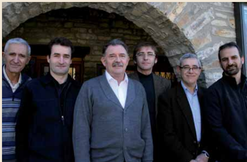
Autoridades en la inauguración oficial.

specie" y explica la rentabilidad económica y social de la conservación de este ave, que califica de vital para la propia supervivencia del territorio. Comparte las experiencias didácticas realizadas tanto en el Eco Museo-Centro de Interpretación de la Fauna Pirenaica del castillo de Ainsa, el Centro formativo Estación Biológica Monte Perdido de Revilla y el Programa de educación ambiental "Conoce la Naturaleza de Aragón".